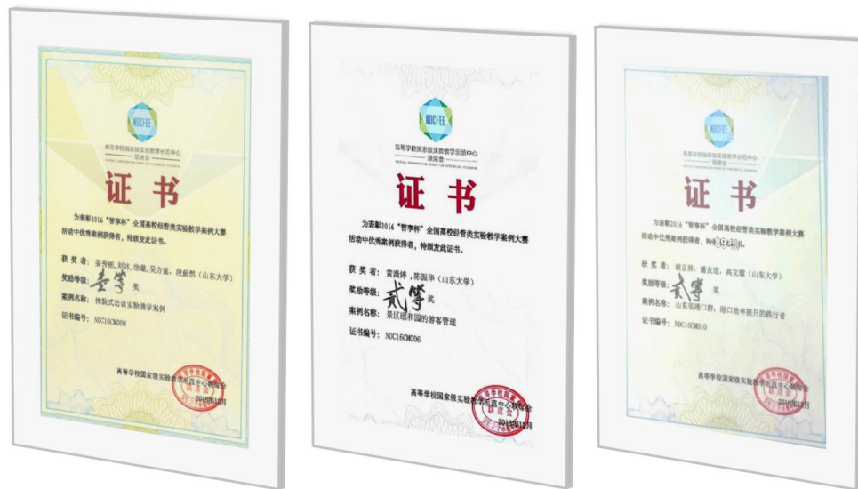
图 5 包揽首届全国经管类实验教学案例大赛决赛管理组前 3 名

2016 年实验中心继续推动实验教学案例的开发与应用，主导了全国经管学科实验教学案例规范的制定；2016 年实验中心开发的五个案例在首届全国经管类实验教学案例大赛中进入初赛前十名，并包揽决赛管理组前 3 名。