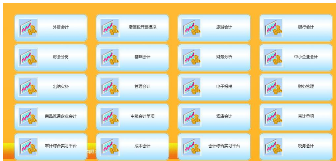
图 3 赛训一体化平台

一体化平台，和实验中心综合信息化平台实现了数据共享，使实验计划、实验过程、实验数据、实验成绩等信息无缝集成。