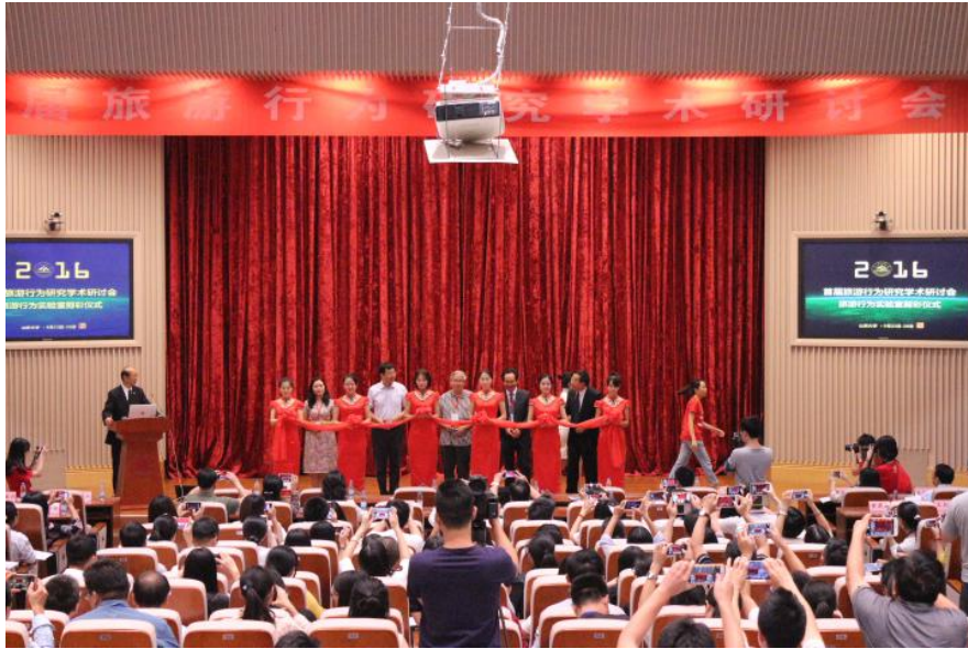
图 4 2016 年承办首届旅游行为学术研讨会及旅游行为虚拟仿真实验室剪彩仪式