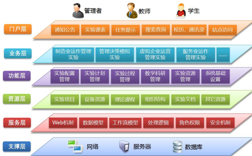
图2 综合信息化平台系统架构

信息化平台建设是示范中心建设的重要方面，山东大学管理学科实验中心基于国家级实验教学示范中心多年的实践应用与提升总结，构建了一套规范化、流程化的实验教学各环节管控信息化平台。